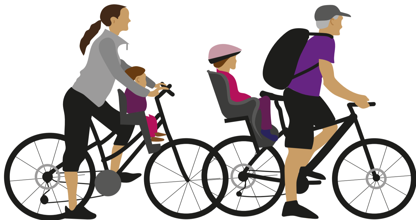
Las sillas según diseño podrán instalarse adelante o atrás del conductor, pero no sobre el manubrio.

Ley 21.088 de Convivencia Vial: "Los ciclos sólo podrán usarse para llevar la cantidad de personas para la cual fueron diseñados. Aquellos cuyas características lo permitan, podrán ser equipados con dispositivos adicionales", como sillas y carros de arrastre.